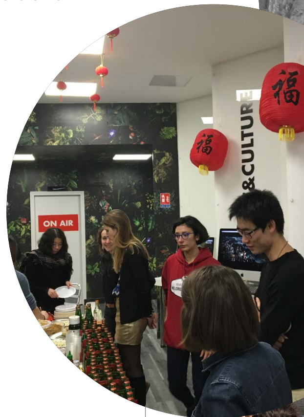
Soirée internationale du Nouvel an chinois à l'IESA avec les étudiants de 30 nationalités.

La vie culturelle internationale se réalise enfin dans les nombreux voyages d'études proposés aux étudiants durant toute la formation afin de découvrir le patrimoine, la scène artistique et les professionnels des grandes capitales culturelles.