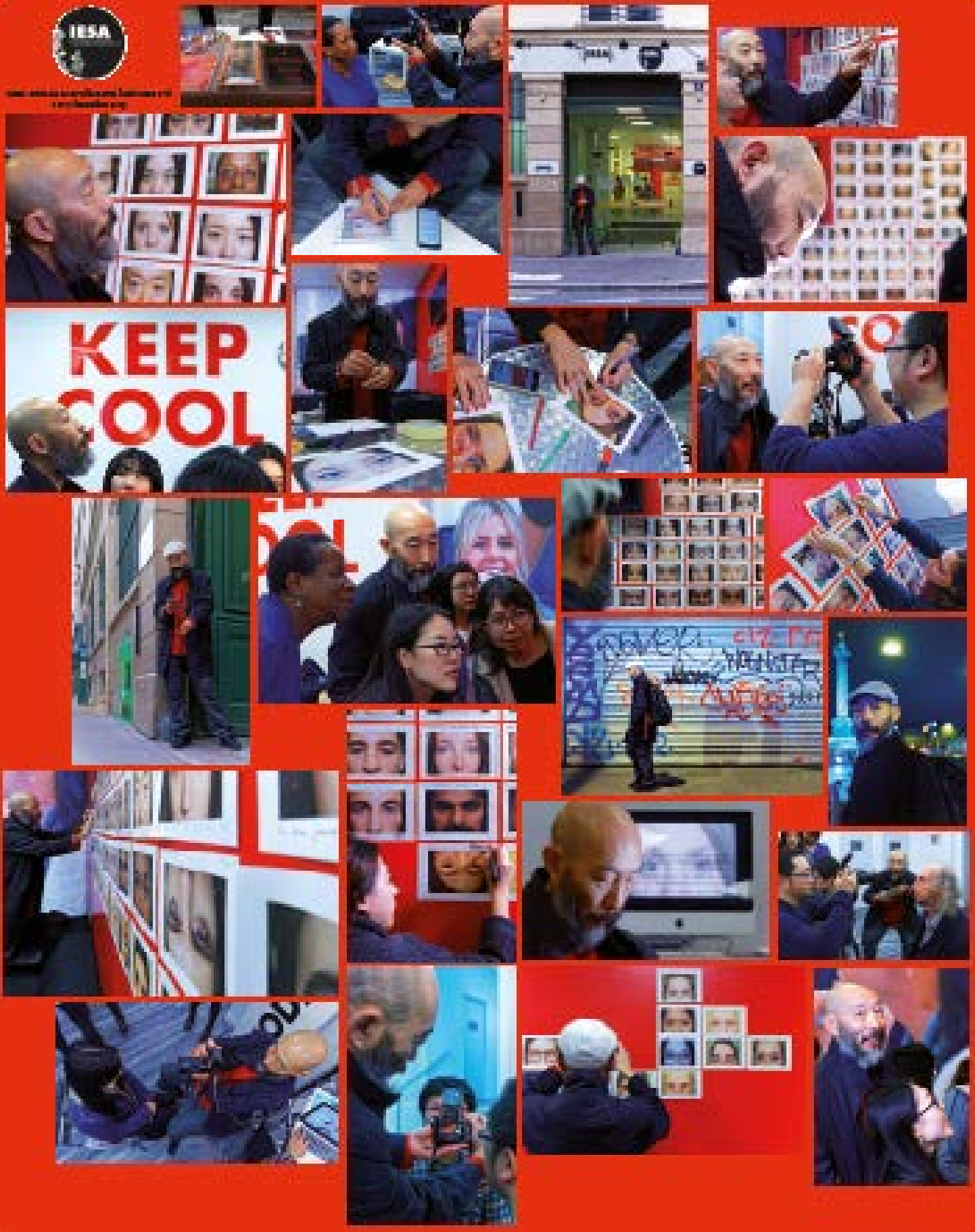
Master class sur le regard et création d'une œuvre à l'IESA arts&culture avec le photographe chinois Mo Yi.

www.iesaparis.com 100 rue de Valenciennes 75013 Paris