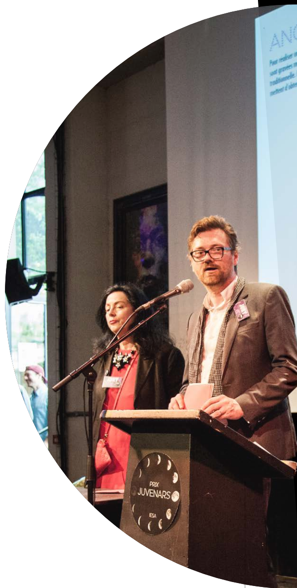
Remise du prix Juvenars - IESA à la Bellevilloise.

Grâce à son incubateur et au développement d'une formation spécialisée «Innovation et entrepreneuriat culturels», l'IESA arts&culture se positionne comme un acteur engagé du développement des entreprises et des pratiques culturelles par les innovations numériques.